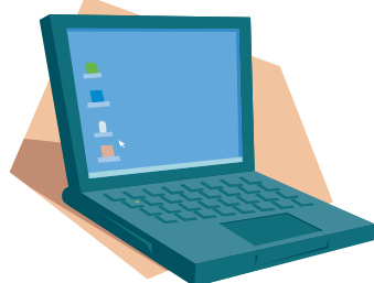
無線LAN機能付きノートパソコン