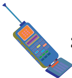
メールが受信できる携帯電話